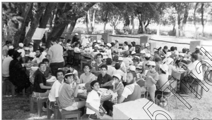
ארוחת צהריים שגרתית - בקמפ חב"ד גם זו חוויה

אני" עכשיו, האם אני לא אמרתי לך תמיד לעשות את זה וסירבת? הוא ענה לי: "את היית מצווה אותי, ואילו הם הסבירו לי שכמו שאדם אומר תודה על מתנה שמישהו נותן לו ככה אנחנו צריכים להודות לד' על המתנה שלו אלינו".