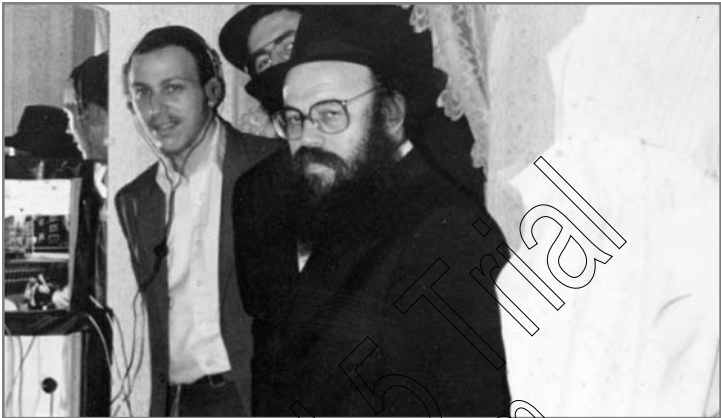
“כשקולו של הרבי נשמע - רות הצעידה פג מלבנו”