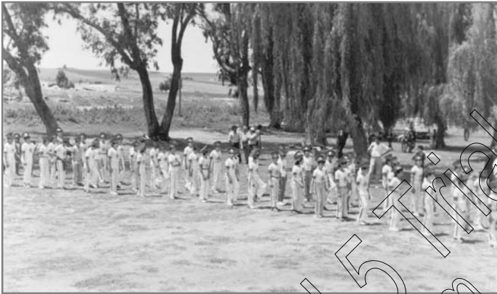
מסדר "צבאות ה'"

'הועלו' לקדושה. למשל, כאשר שיחקו בכדורגל, הוענק לתחרות השם "מבצעים" לקבוצות ניחנו שמות כגון: חינוך, תורה, תפילין, מזוזה, צדקה, כשרות.