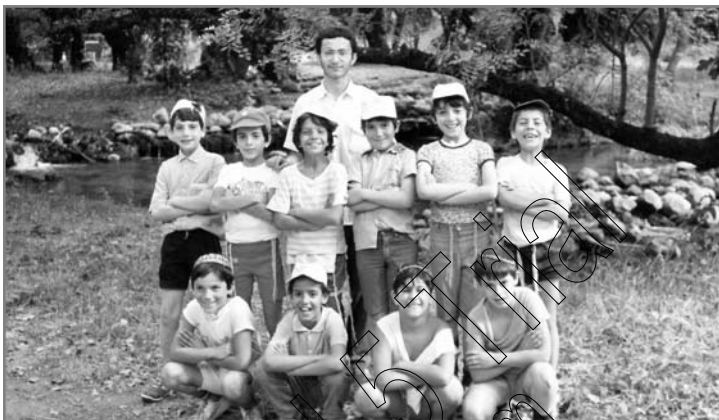
מתקשים להסתיר את האושר

והרב שלום שי' אינדלמן, נשאו נאומים תורניים, בנגלה, בחסידות, בדרוש ובאגדה. את התמימים 'יצג' הת' שניאור זלמן בלומנפלד אשר נשא פלפול תורני-מרשים.