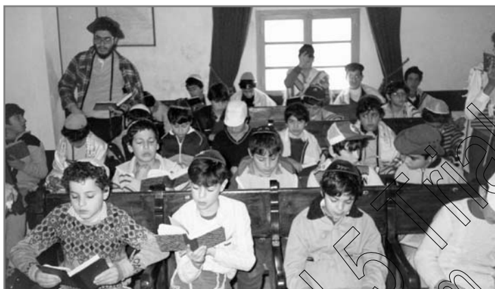
תמימות עהורה נשקפת מפניהם של הילדים