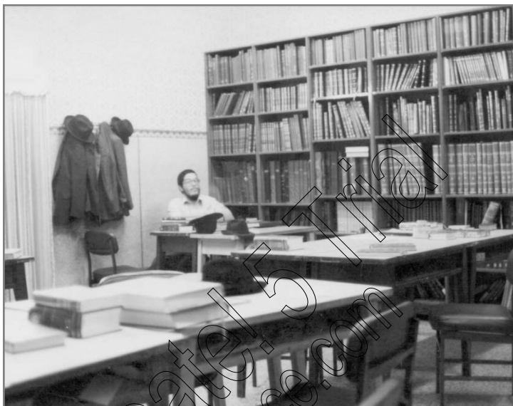
זאל הישיבה בעת הפסקה