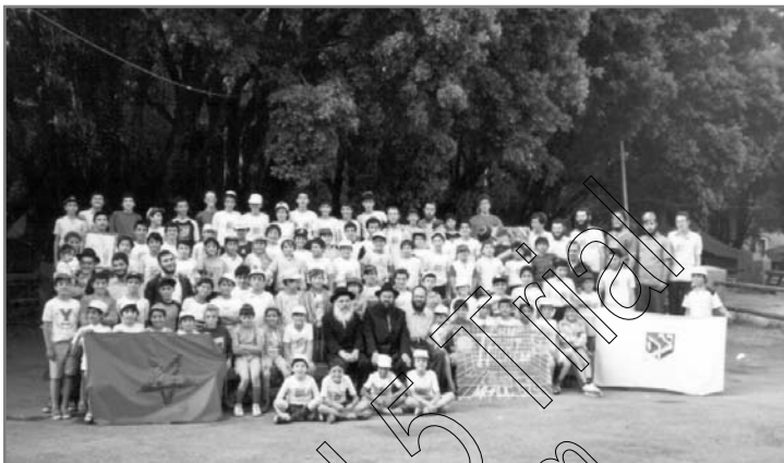
ילדי הקעמפ בתמונה קבוצתית

מחברי הקבוצה, "בסגנון "פוצו", כלומר הפצה רחבה ללא סינונים".