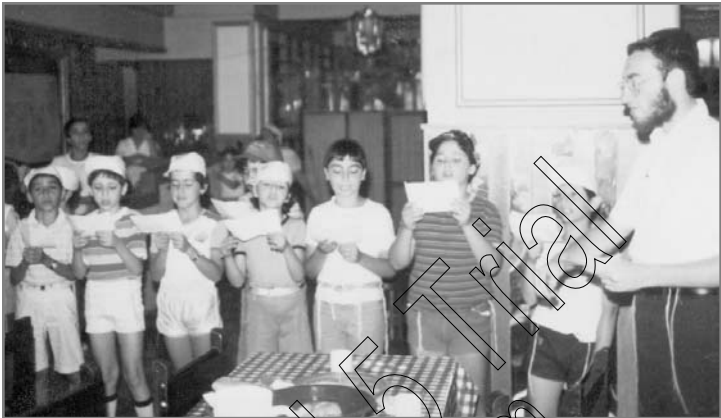
ושונתם לבניך - אלז התלמידים