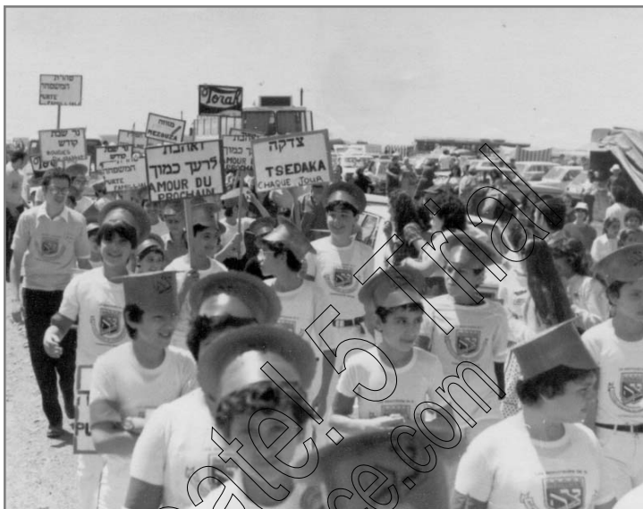
תהלוכת ל"ג בעומר

ויותר קשישים קבלו חשק להיות קרוב למצווה, ובערב השמיני כמעט כולם נכחו. מנהלת המקום אמרה לרב רסקין שאת המהפכה שהתחוללה אצל הזקנים במהלך שבוע החנוכה, אי אפשר לתאר.