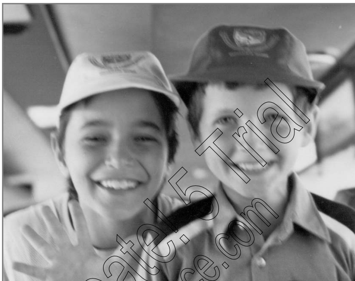
ילדי מועדון "צבאות ה' במרוקו

בקיצור – היא מפחדת מאוד על עתידו, מה יהיה אתו. דבריה היוצאים מן הלב – פעלו, והילד התקבל מיידית לקמפ. שמנו עליו עין, קרבנו אותו ושוחרנו אתו ממושכות. נתנו לו לקרוא את ספר הזיכרונות (בצרפתית) כדי שיתרשם ממקור ראשון מה זה יהדות, יהודים, מסירות נפש וכו'. בקיצור, התמסרנו אליו. הילד השתתף בהתוועדויות שהתקיימו במחנה, וניכר היה שהוא הולך ונכבש. באחת מההתוועדויות, הוא פרץ בבכי אשר ממנו לא נרגע משך דקות ארוכות. מיקדנו אפוא אליו תשומת לב רבה וב"ה ההתקדמות לא אחרה לבוא. הילד עזב את השקפותיו הילדותיות הנלוזות והתקרב אל היהדות. כשחזר לביתו, שב לברך לפני האכילה ואפילו להכין ערכת נטילת ידיים על-יד המיטה.