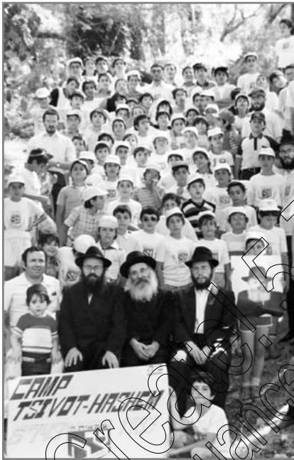
הרבנים ממוסד ורסקין בראש צאן הקדשים

פרוייקט הוצאת-הספר הוא סיפור נפרד ונוסף על הוצאה סדירה של קובצי הערות התמימים שתלמידי הישיבה הוציאו מדי חודש בתודעתו, ושלחו עותקים ממנו אל הרבי וגם לישיבות אחרות בעולם. (על ההוצאה והקשיים שנערמו ראה במוסף).