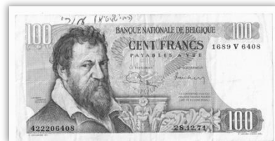
תמונת השטר שקיבלתי מאת כ"ק אדמו"ר