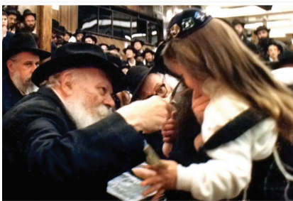
י"א שבט תש"נ

עברה משאית ענק ועלי עשרות ילדים בני גיל שלוש שהיום עושים להם תספורת ("אָפּשערעניש") בליווי אבותיהם שהחזיקו בידם מספריים, וכשעברו – עשה כ"ק אדמו"ר שליט"א תנועות גזיזה באצבעותיו הק' בחיוך, והאבות החלו בתספורת.