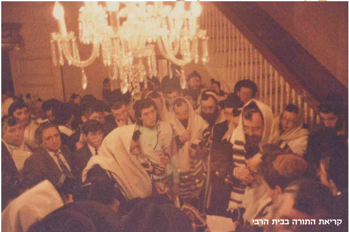
קריאת התורה בבית הרבי