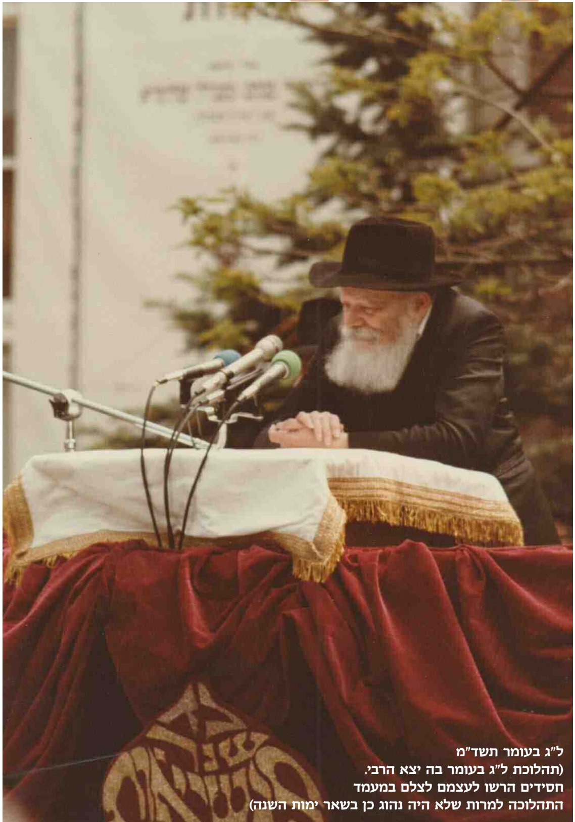
ל"ג בעומר תשד"מ (תהלוכת ל"ג בעומר בה יצא הרבי. חסידי הרשו לעצמם לצלם במעמד התהלוכה למרות שלא היה נהוג כן בשאר ימות השנה)