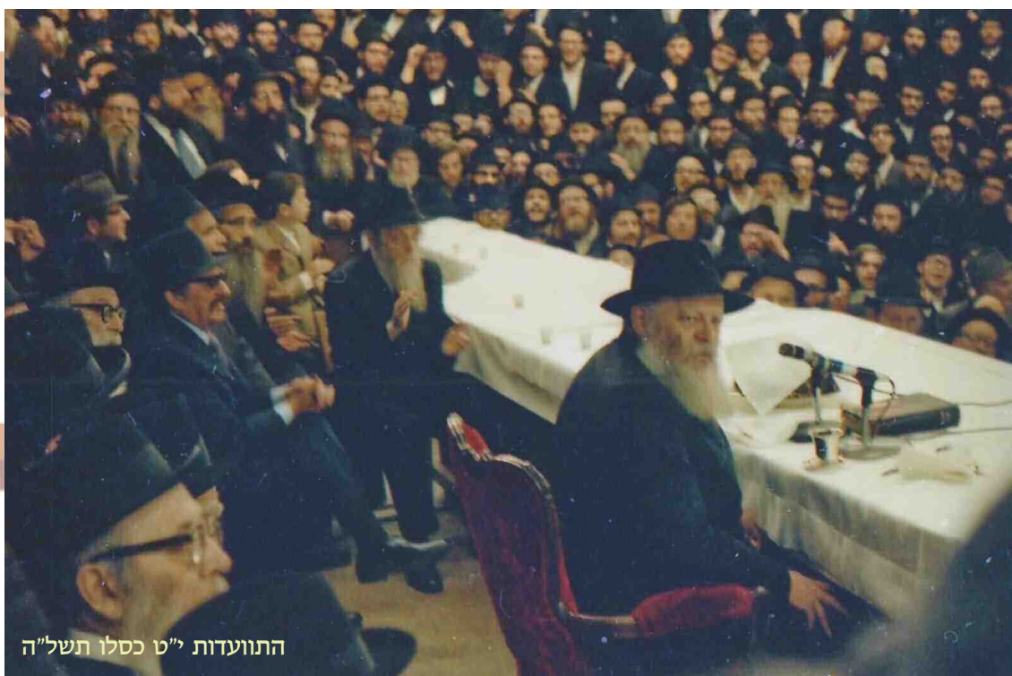
התוועדות י"ט כסלו תשל"ה