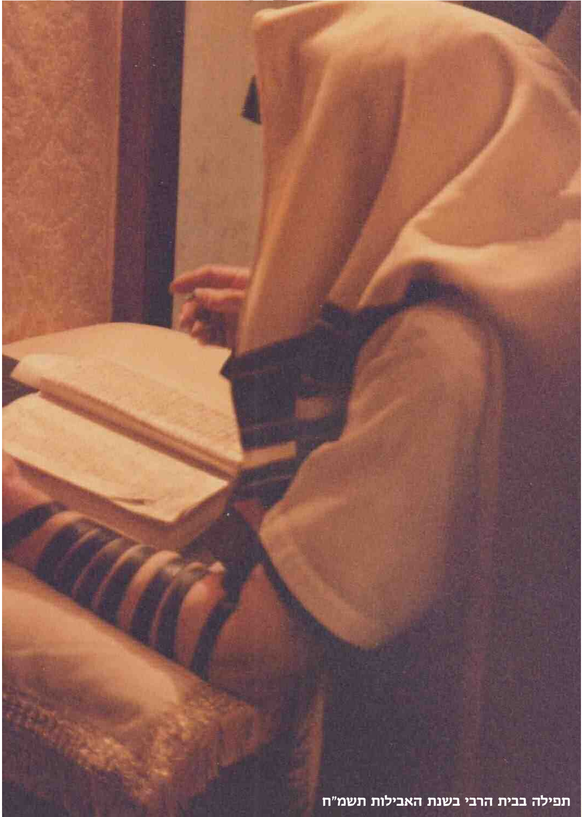
תפילה בבית הרבי בשנת האבילות תשמ"ח