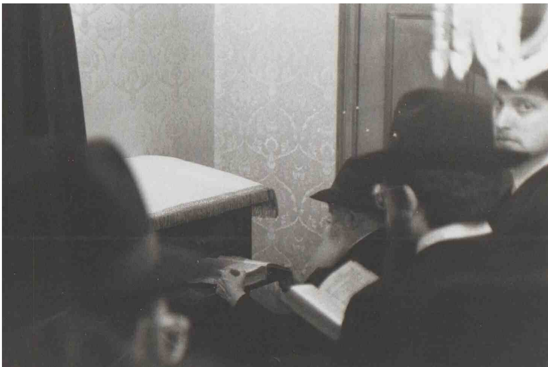
תפילה בבית הרש"ג לאחר פטירתו, בקומה השלישית של 770 (הרש"ג היה מקבל יחס מיוחד מהרבי, בהתוועדויות היה יושב על יד שולחן הרבי, היה היחיד שרקד בשמח"ת עם הרבי, והיה מתייעץ עם הרבי בכל דבר וענין)