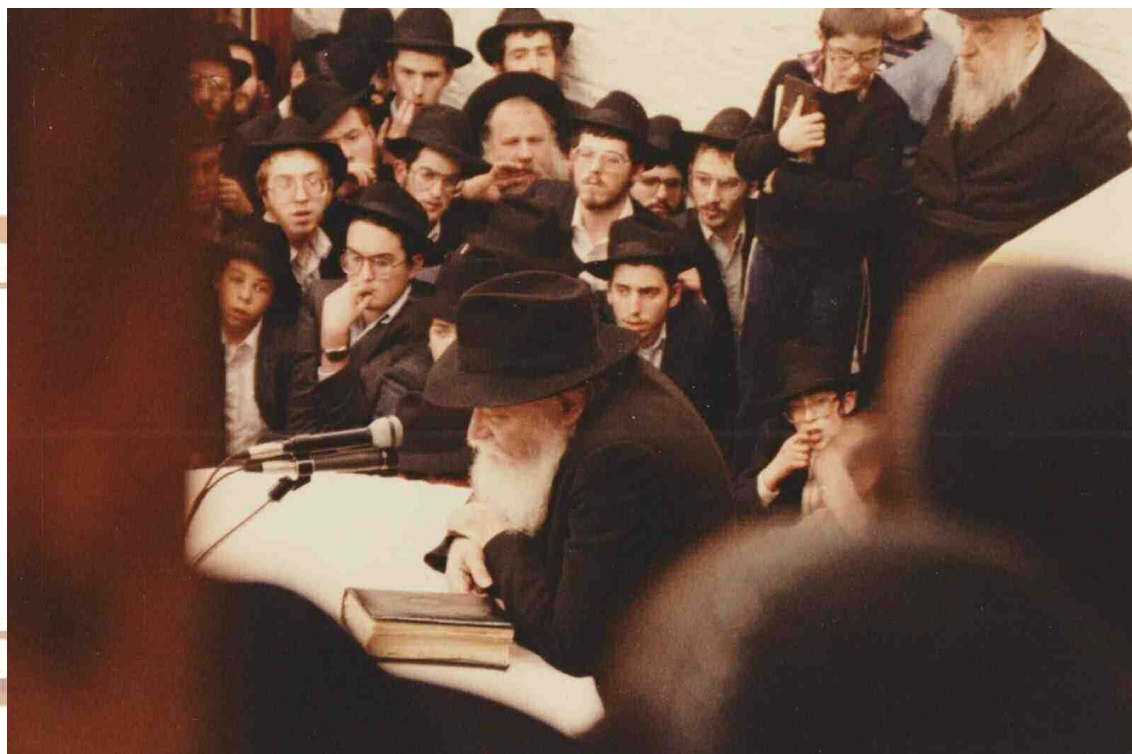
שיחה מיום חמישי שאחר ה' טבת, שבהם כל יום הרבי אמר שיחה. צולם רגעים אחדים לפני שהרבי גמר את השיחה