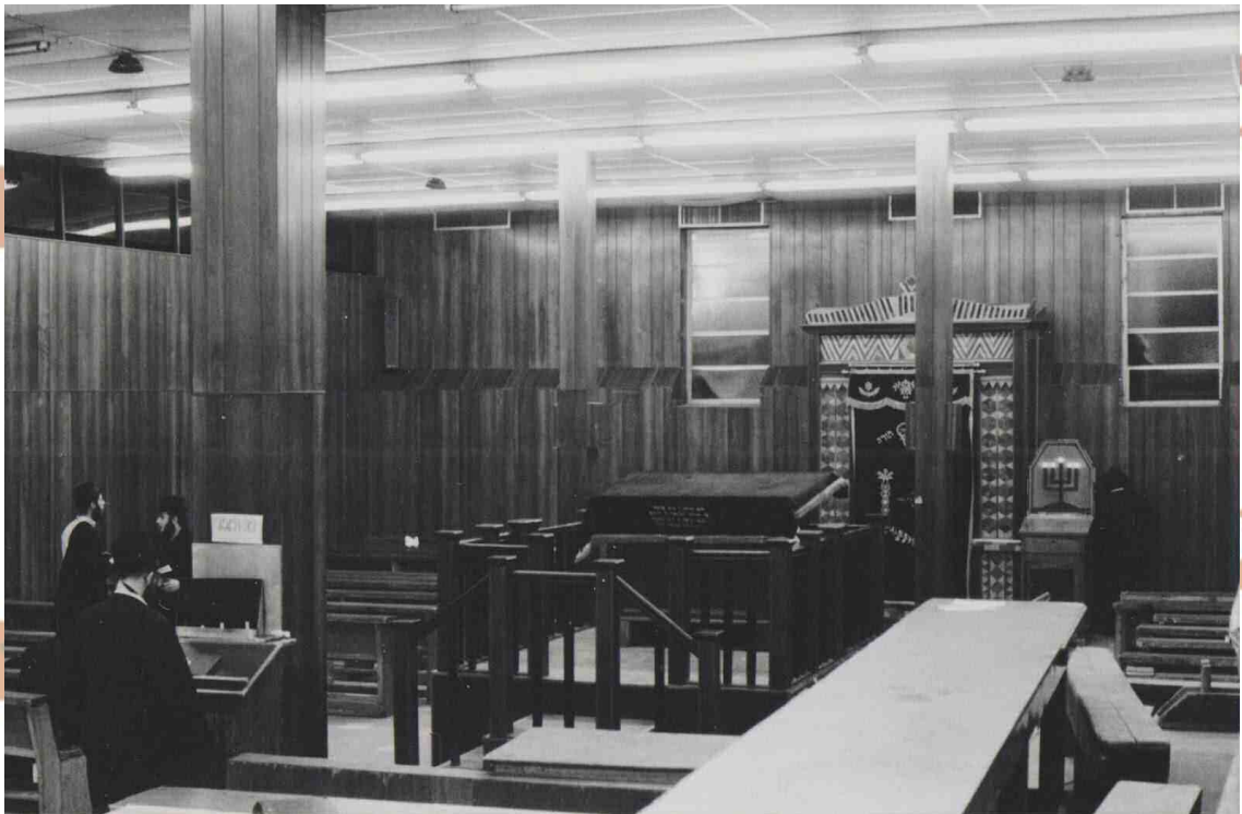
מראה 770, עש"ק אחר חצות פרשת ויחי י"ג טבת תשל"ב, בפעם הראשונה שאב החתן הגיע לרבי (3 שנים לפני הרחבת 770, ובאותה תקופה התועדויות היו צפופות ביותר)

חלק קטן מתמונות שנלקחו ע"י אבי החתן בשנים תשל"ב - תשמ"ט בפרסום ראשון