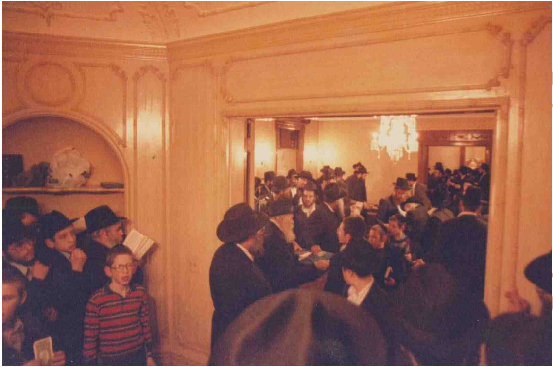
מראה חלוקת דולרים בבית הרבי בשנת תשמ"ט (קרוב לסיום שנת האבילות על הרבנית)