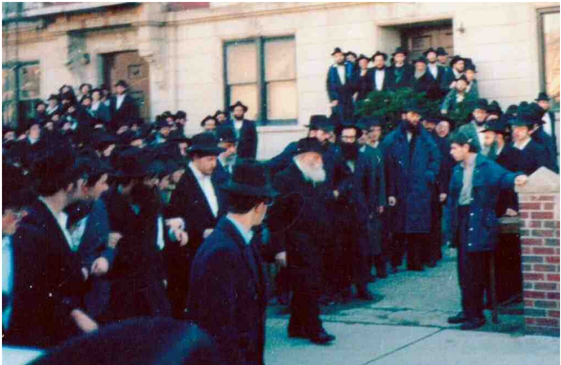
הרבי בחזרתו ל 770 מלוויה (הרבי תמיד היה יוצא אחר לוויה בכביש וחוזר דרך המדרכה כדי לחזור בדרך אחרת, כמנהג ישראל)