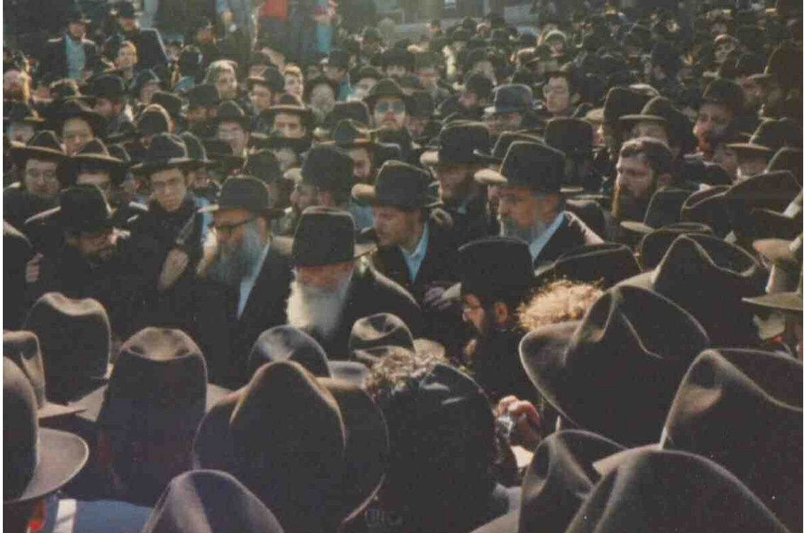
בהלוויית הרב שמריהו גוראריה (הרש"ג היה חתנו של הרבי הרי"צ, גיס הרבי) ו' אדר א' תשמ"ט, (מהפעמים הבודדות שהרבי יצא ללוויה באותה תקופה)