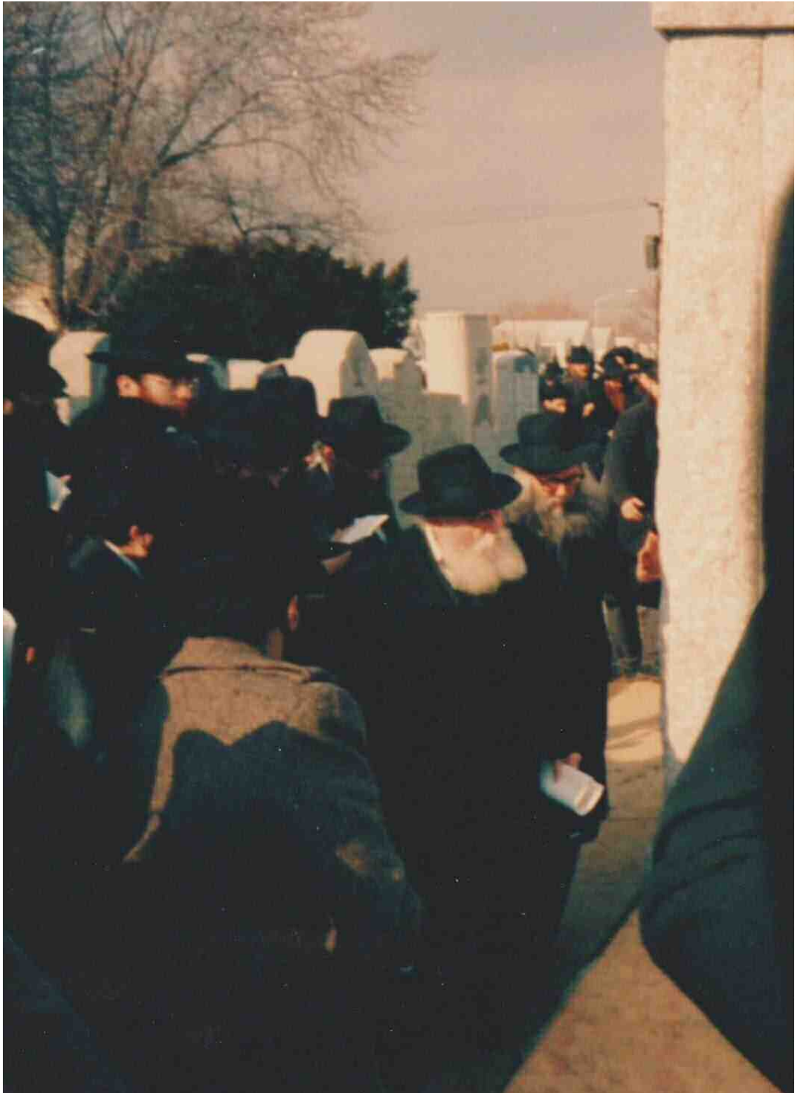
במעמד הקמת המצבה של הרש"ג, י"ד אדר א' תשמ"ט (זו הפעם היחידה שהרבי הגיע להקמת מצבה)