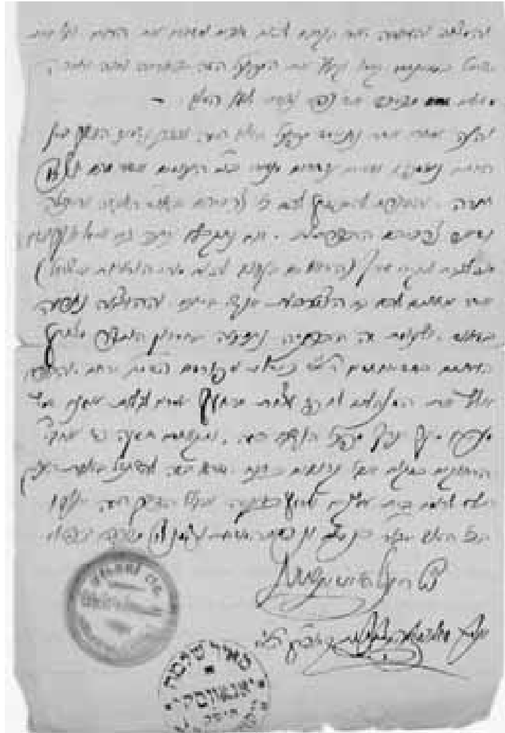
מכתב בחתימתו של הרמ"ש יאנאווסקי