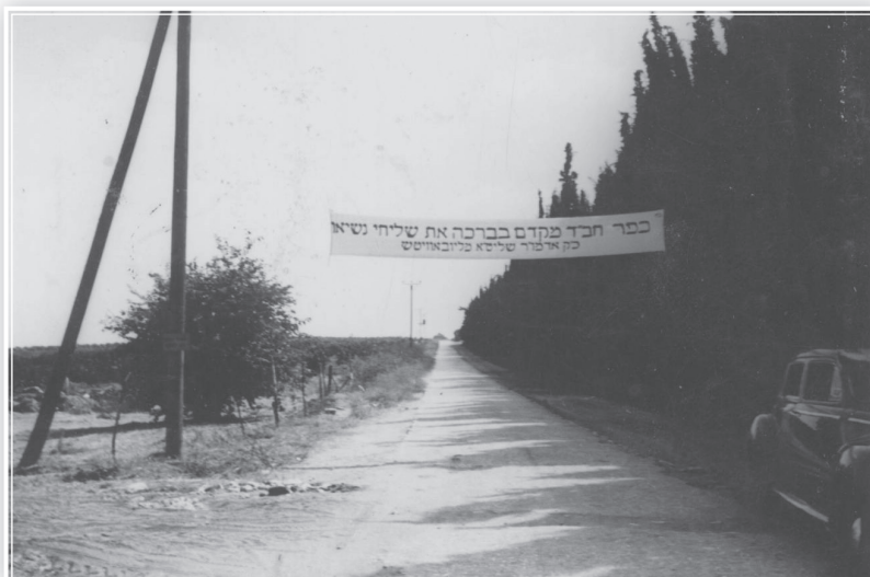
כרות ברכה לשלוחי הרבי בקיץ תשט"ז בכניסה לכפר חב"ד