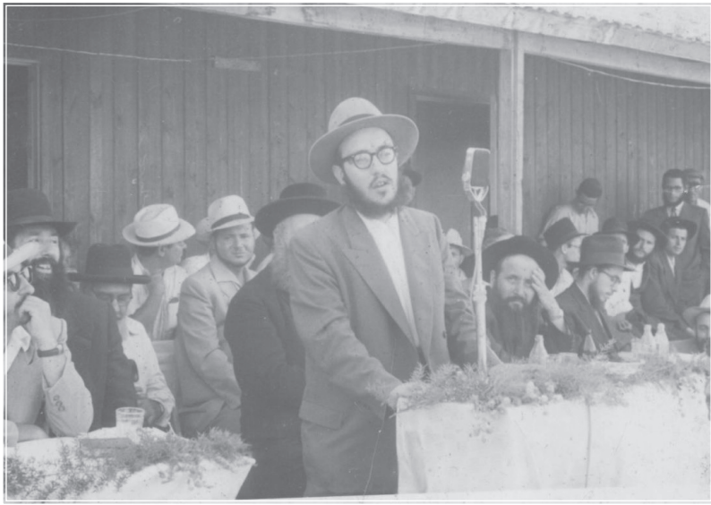
נואם בחנוכת הבית של 'פעילים יד לאחים' בבאר שבע, במהלך השליחות בקיץ תשט"ז

ההתועדות השאירה רושם בלתי משוער על הנוכחים, מען האט ממש אויפגעלעבט [החיון], ובפרט אנ"ש. אחר ההתועדות הלכו כמה אנשים עמנו למלון אר"י, מהם שאכלו, ומהם שרצו לשמוע ממנו עוד איזה דברים ושיחות כ"ק אד"ש.