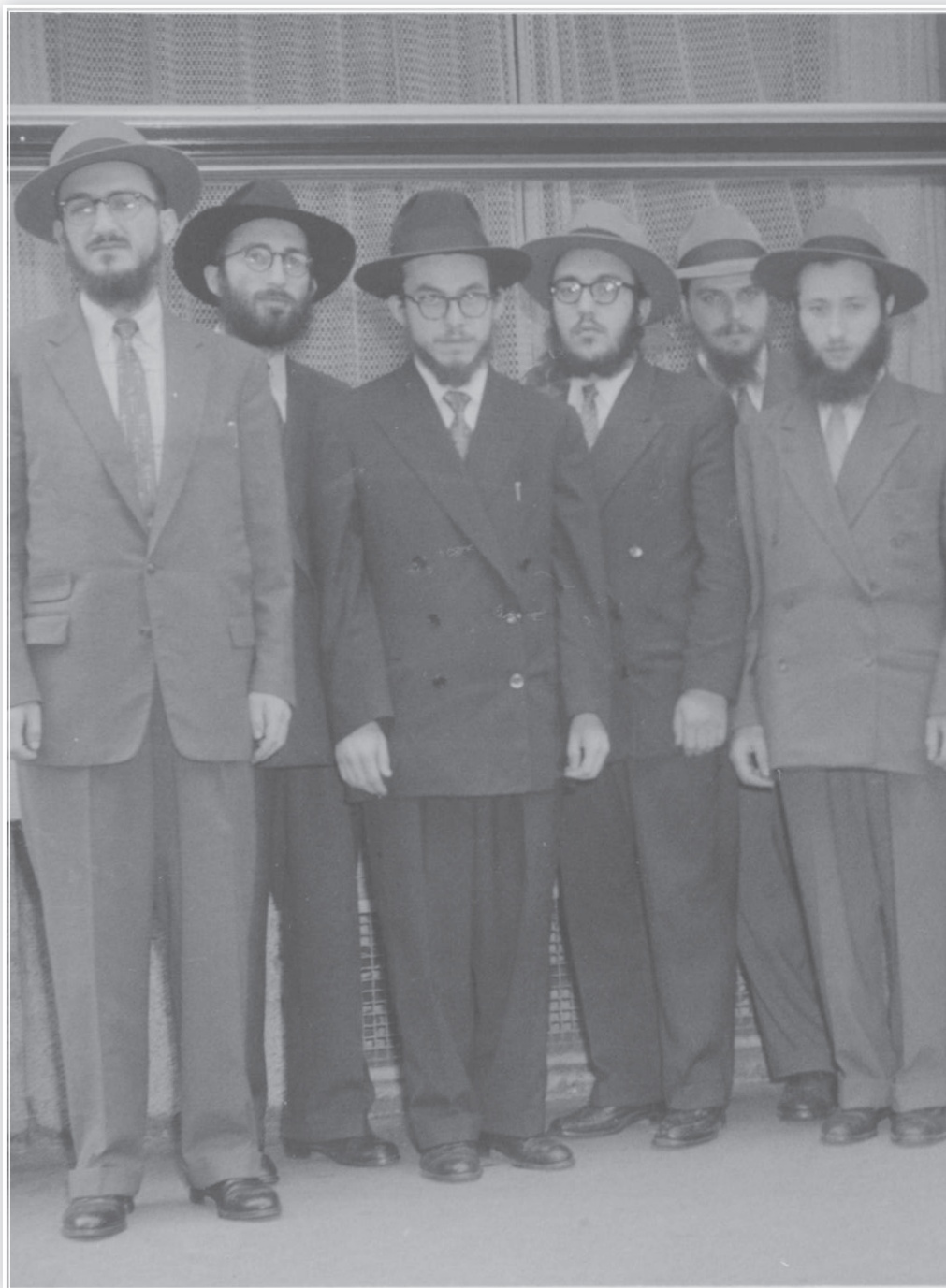
שלוחי הרבי בתשט"ז בתחנת ביניים בציריך