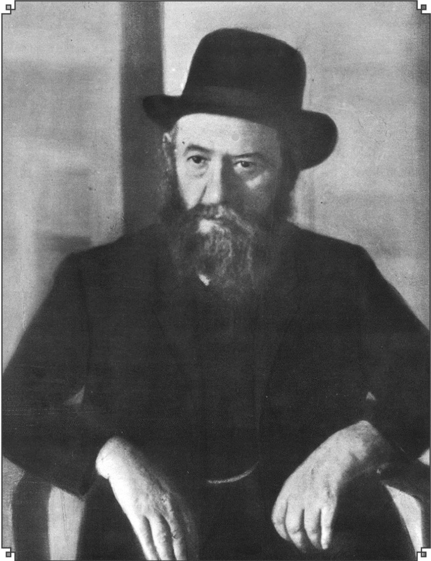
כ"ק אדמו"ר מוהר"ר שלום דובער זצוקלה"ה נבג"מ זי"ע מליובאוויטש כ' מר חשוון תרכ"א - ב' ניסן תר"פ