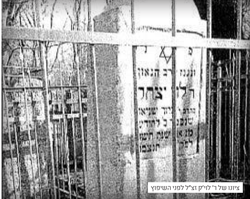
ציונו של ר' לויק זצ"ל לפני השיפוך

יום אחד המשפחה המלכותית הלכה לקרקס (הצאר ואשתו, הבן ואשתו). ושם - האריה השתולל והשתולל.