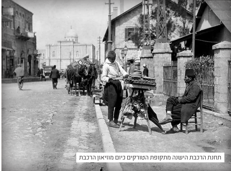
תחנת הרכבת הישנה מתקופת הטורקים כיום מוזיאון הרכבת