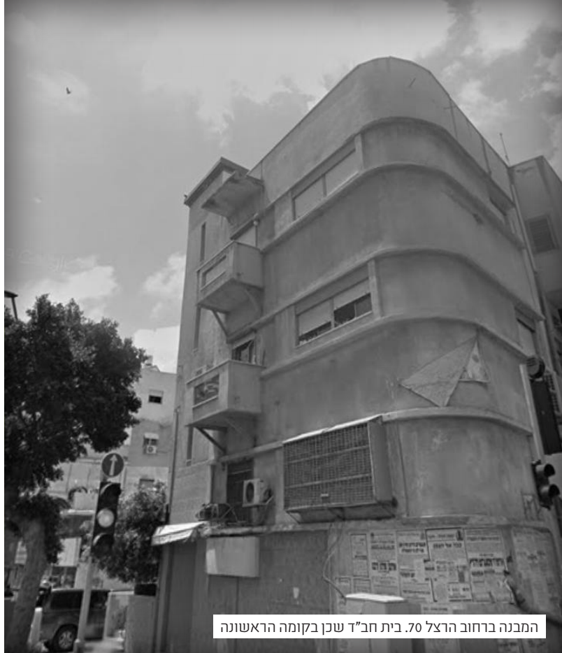
המבנה ברחוב הרצל 70. בית חב"ד שכן בקומה הראשונה