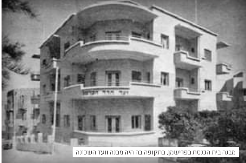
מבנה בית הכנסת בפרישמן, בתקופה בה היה מבנה וועד השכונה