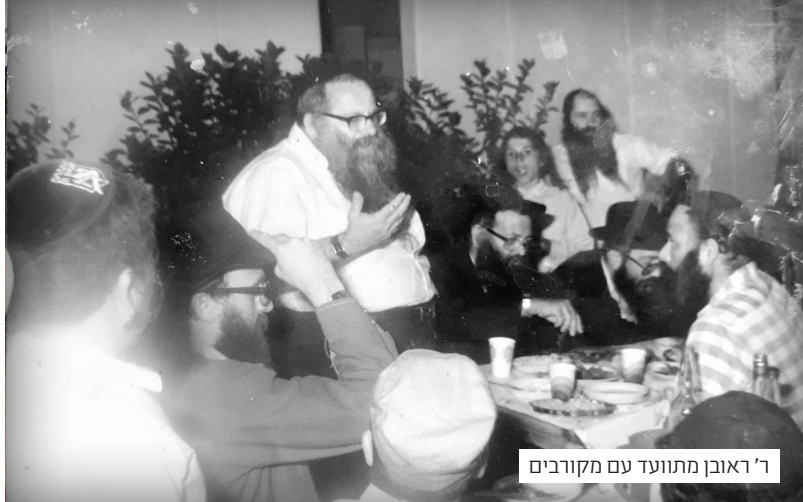
ר' ראובן מתוועד עם מקורבים