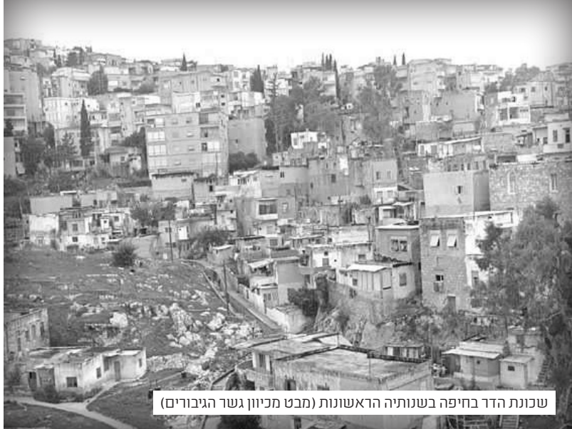
שכונת הדר בחיפה בשנותיה הראשונות (מבט מכיוון גשר הגיבורים)