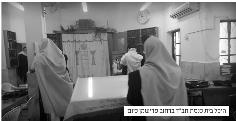
היכל בית כנסת חב"ד ברחוב פרישמן כיום

הכנסת הועבר בהסכמת הרבי למקומו העכשוי בסימטת פרישמן פינת סימטת יהושע.