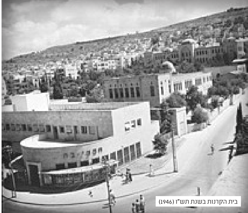
בית הקרנות בשנת תש"ז (1946)

הרב שמזדקן שוכח מה כתוב בספרי ההלכה וזוכר כמו הרבנית מה נהגו לעשות בבית הוריו.