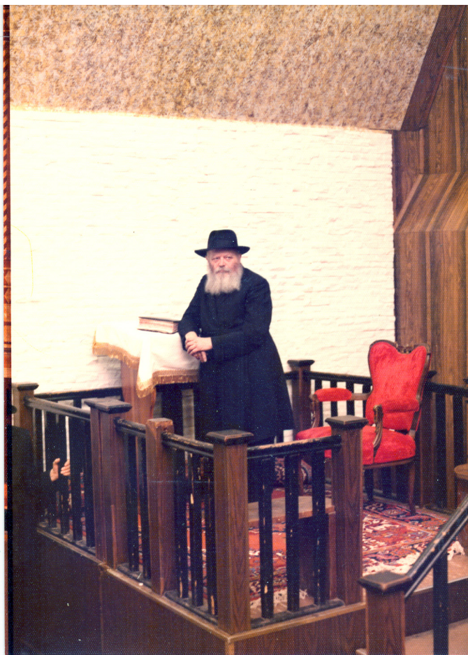
כינוס ילדים – חנוכה תשל"ו