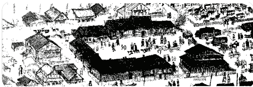
ציור מראה העיירה ליובאוויטש