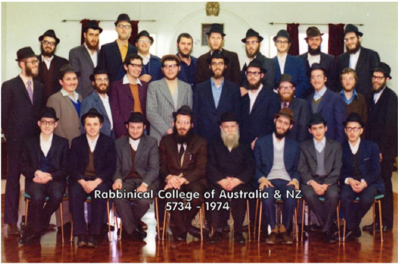
Rabbinical College of Australia & NZ 5734 - 1974