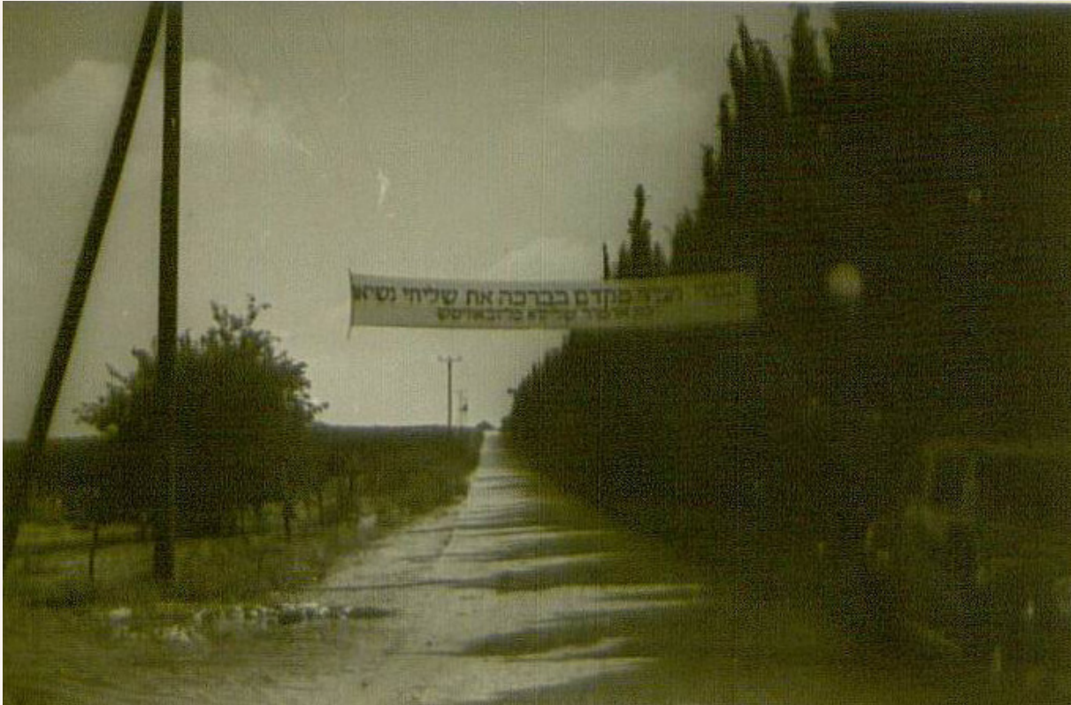
מודעת "ברוכים הבאים" שקידמה את פני ביקור השלוחים