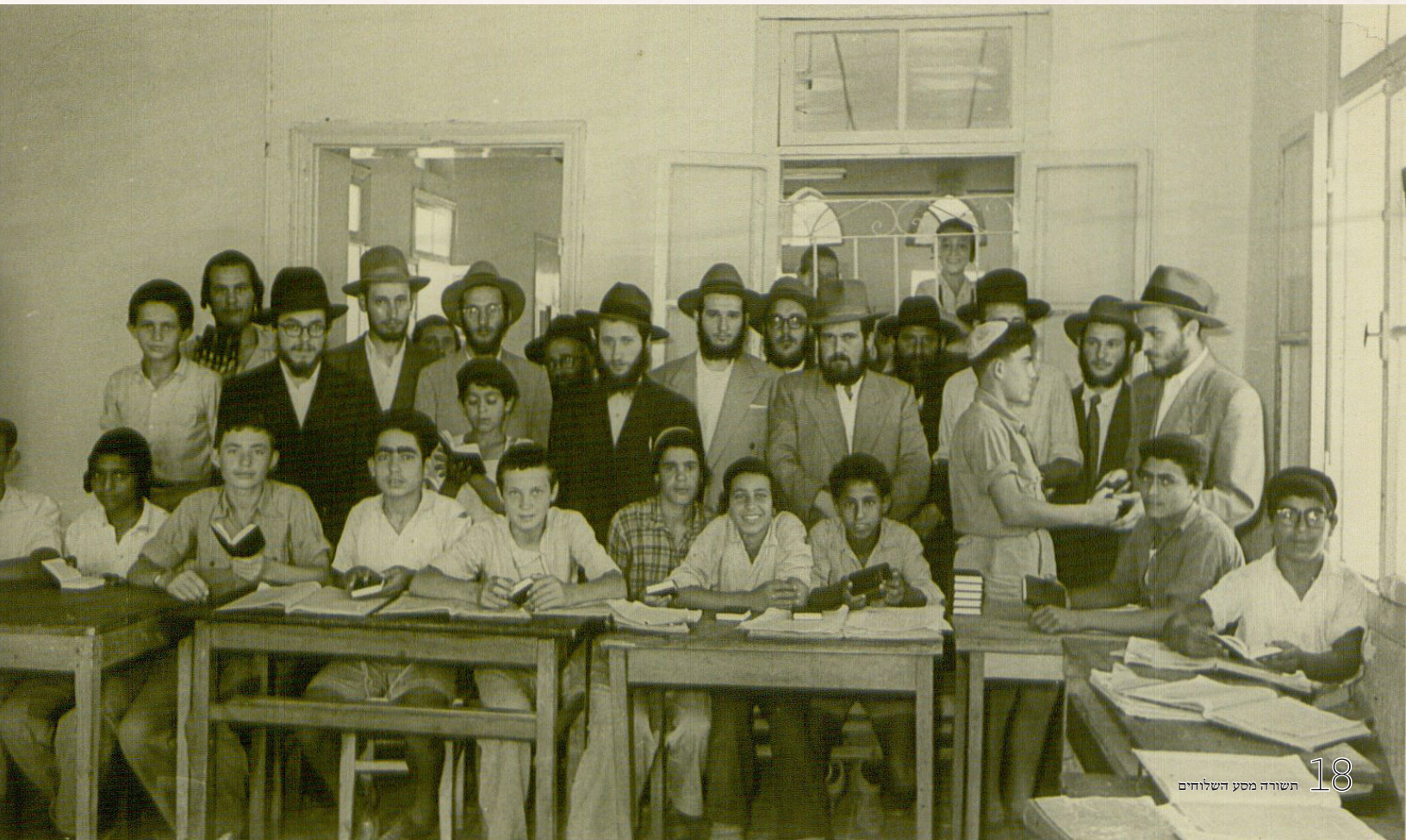
השלוחים עם תלמידים בבית ספר למלאכה

אברהם קארף דיבר מהשיחה של כ"ק אד"ש ל"ג בעומר תשי"ג אודות ר' עקיבא שראה איך שמים ע"י שירדו הרבה זמן עשו חור באבן, שזהו הוראה שאפילו אם לומדים לאט לאט מ"מ