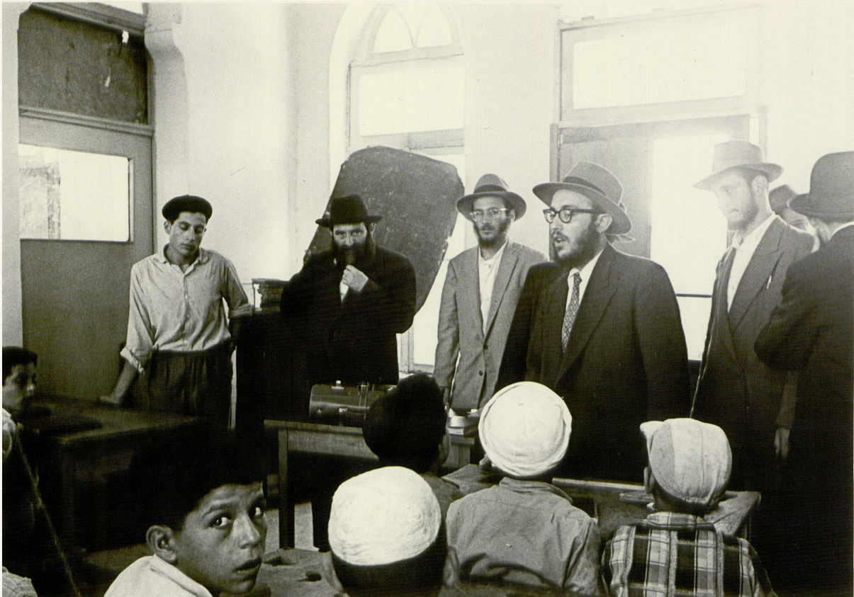
השלוחים נואמים בבית ספר

לנוכחים פרישת שלום מיהדות אמריקה והר' פייוול רימלר ביאר ענין בחסידות.