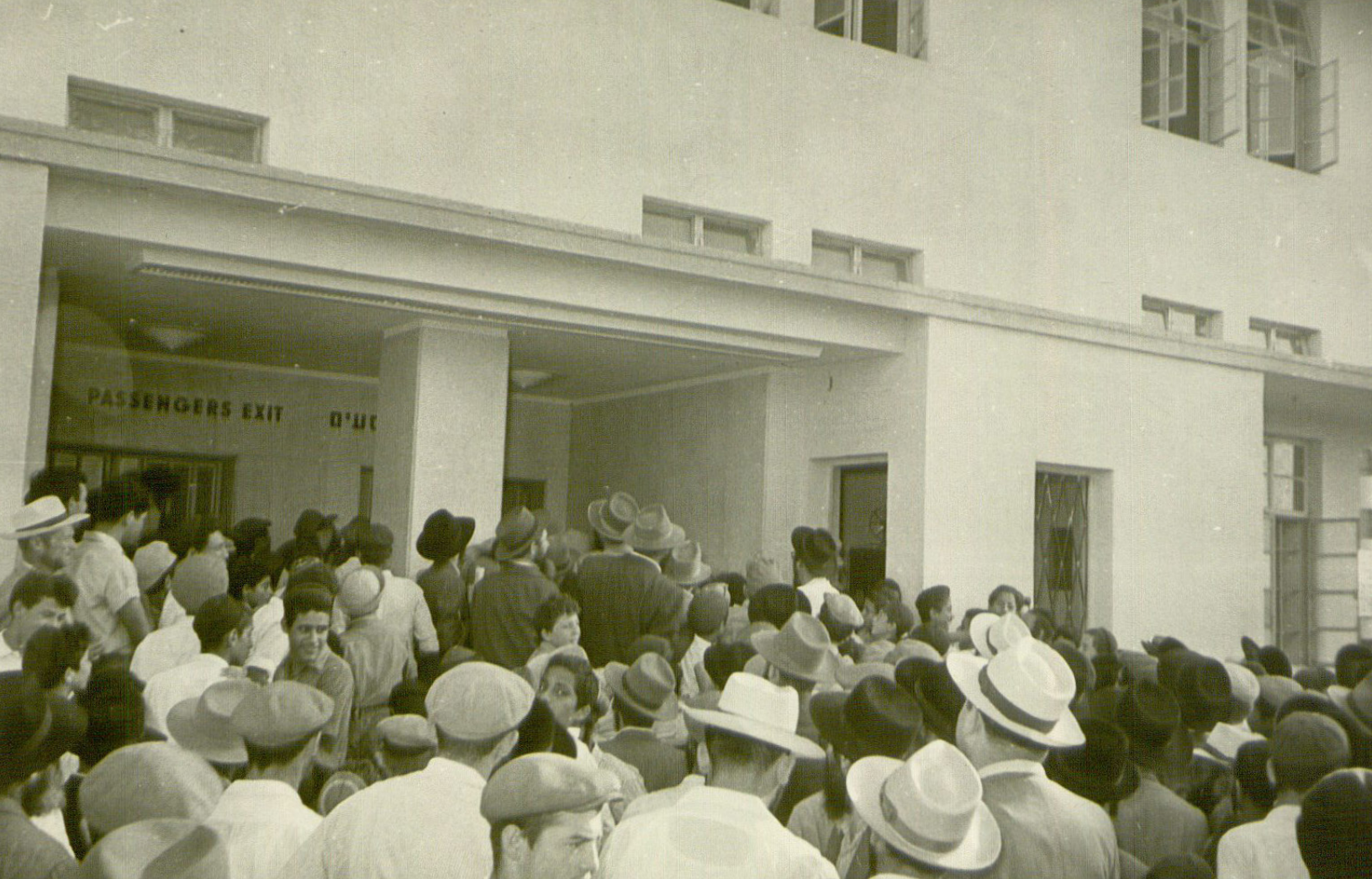
קבלת הפנים בשדה התעופה, יום שישי ה' מנחם-אב תשט"ז