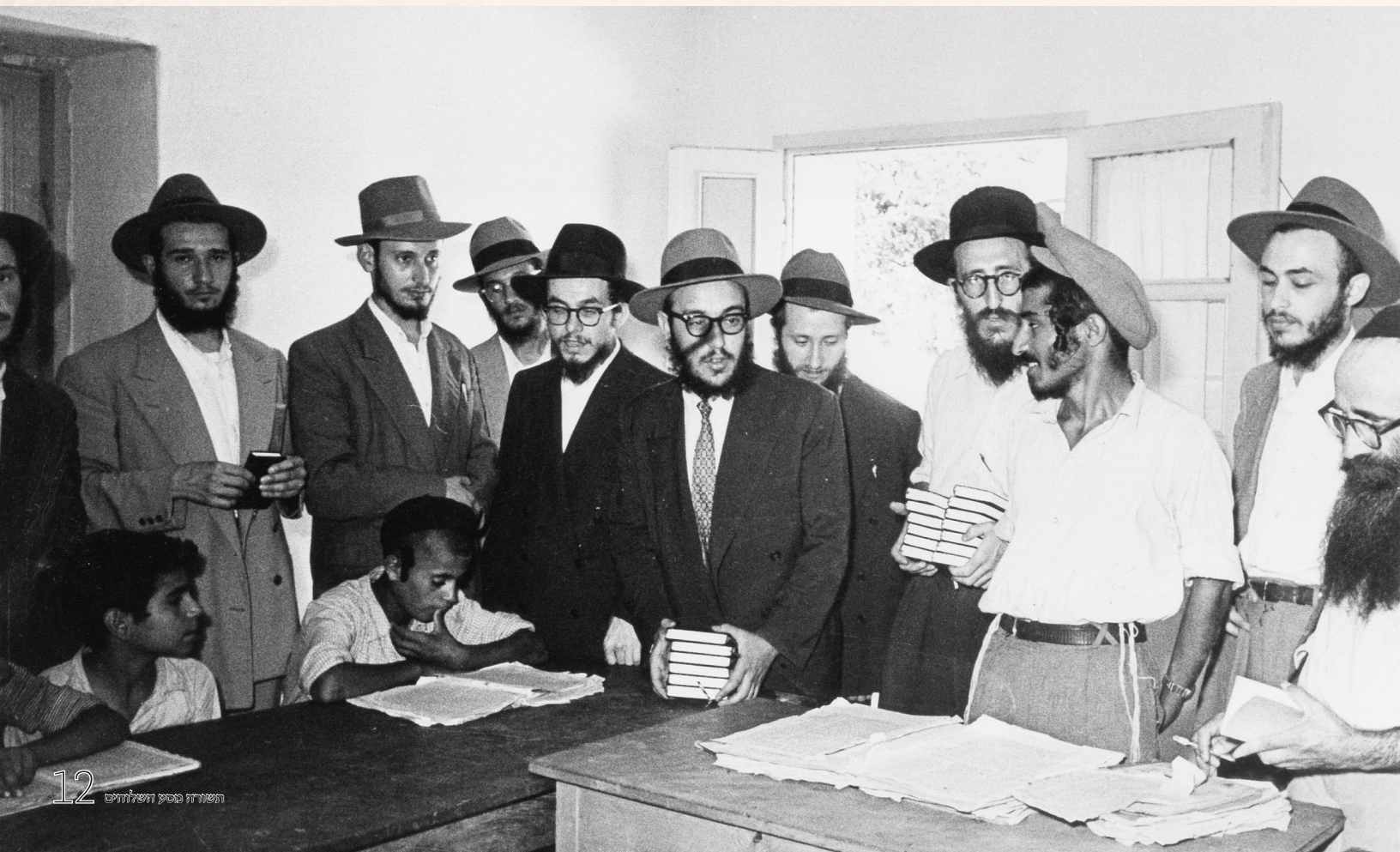
The shluchim distribute pocket-sized Tanyas to the children of the chabad school in Lod, Eretz Yisroel

Rosh Chodesh Elul brought the historic trip closer to its end. On their final night, the Shluchim spent all night farbrenging with the bochurim in Kfar Chabad,