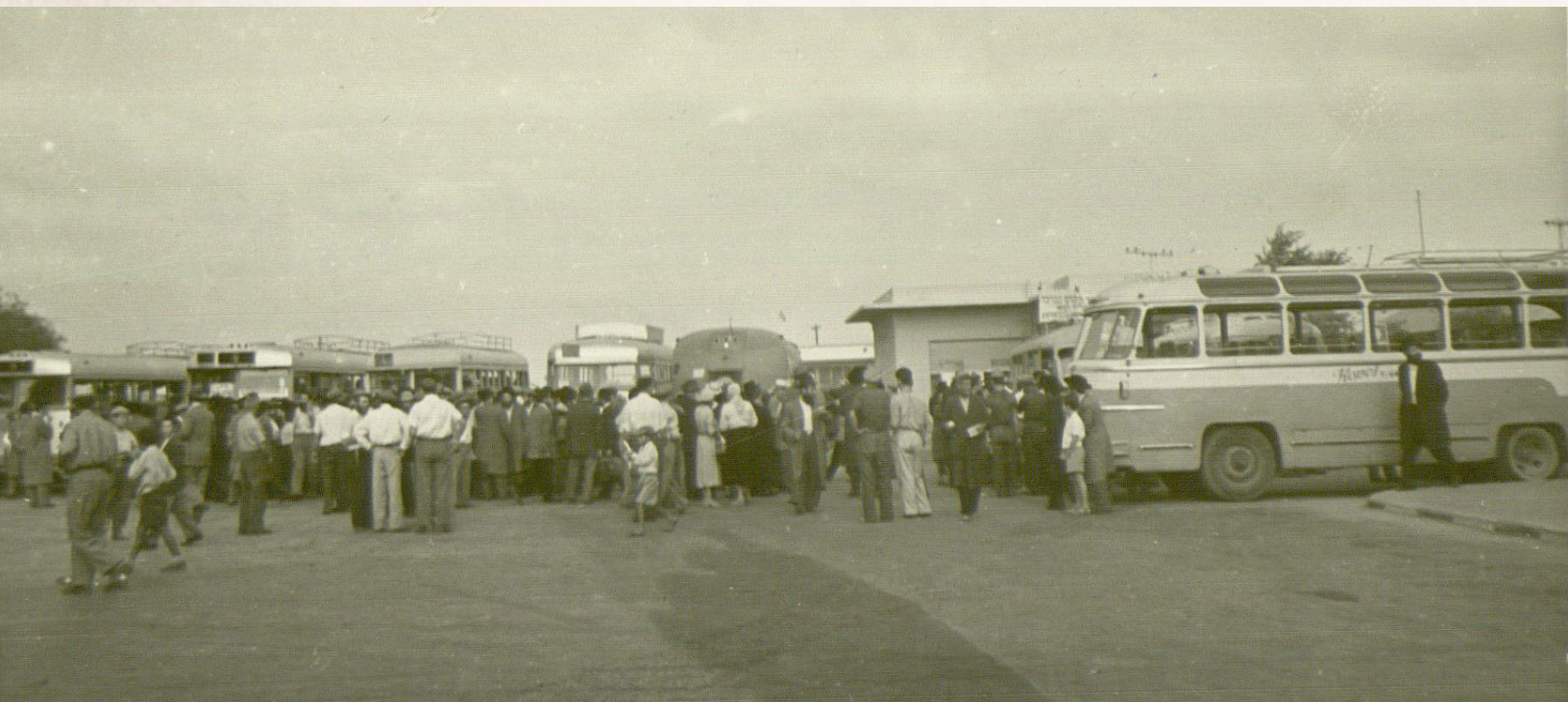
קבלת הפנים בשדה התעופה, יום שישי ה' מנחם־אב תשט"ז

השבת הראשונה בה שהו השלוחים בכפר־חב"ד, לא תישכח לעולם ממשתתפיה. אמנם היתה זו שבת חזון, אבל האווירה בכפר היתה כבשמחת־תורה. שבת כזאת לא ראה הכפר מאז יום הקמתו. מי לא בא לאותה שבת!