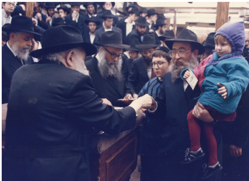
אבי הכלה עם תבלחט"א הכלה מקבלים דולר מהרבי