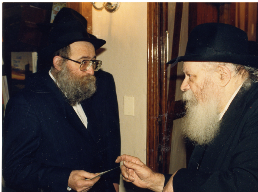
אבי הכלה מקבל דולר מהרבי