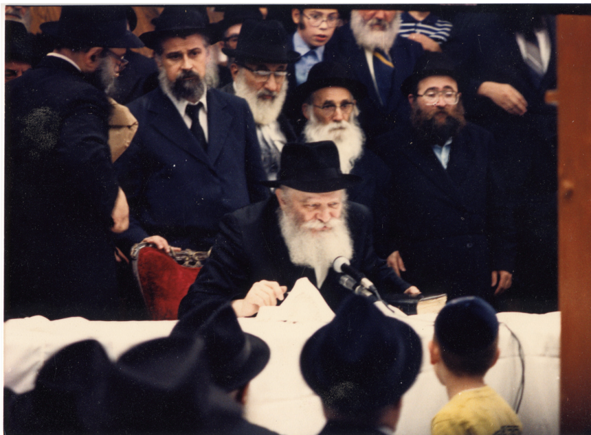
אבי הכלה יושב מאחורי הרבי