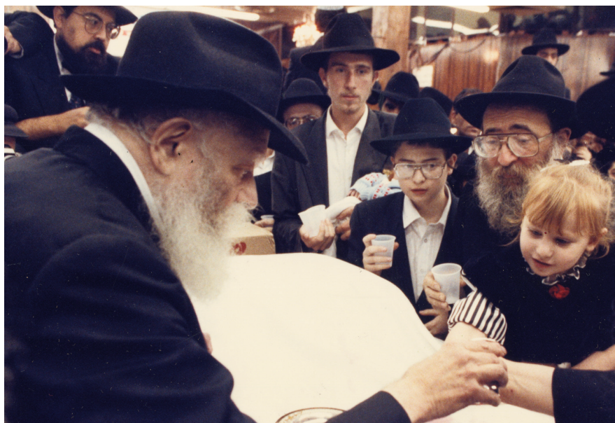
אבי הכלה עם תבלחט"א הכלה מקבלים כוס של ברכה מהרבי