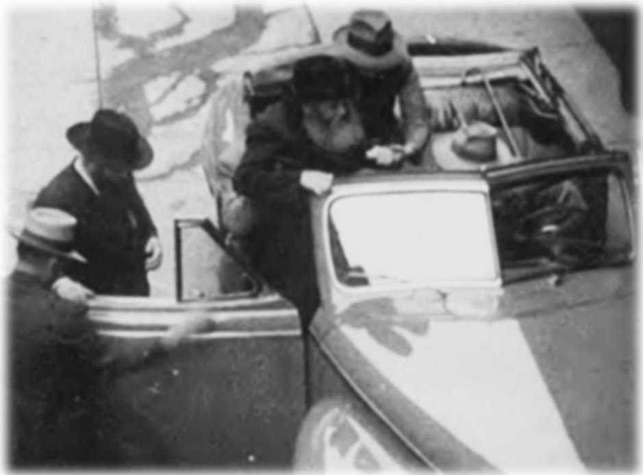
"הנסיעה התקיימה ברכב בעל גג נפתח" (מפי השמועה תמונה זו מהנסיעה למאריסטאון)

הנסיעה התקיימה ברכב בעל גג נפתח, שהודות לכך התאפשר לכ"ק אדמו"ר מהוריי"צ להכנס בקלות לרכב, מכיסא הגלגלים בו היה נע ממקום למקום.