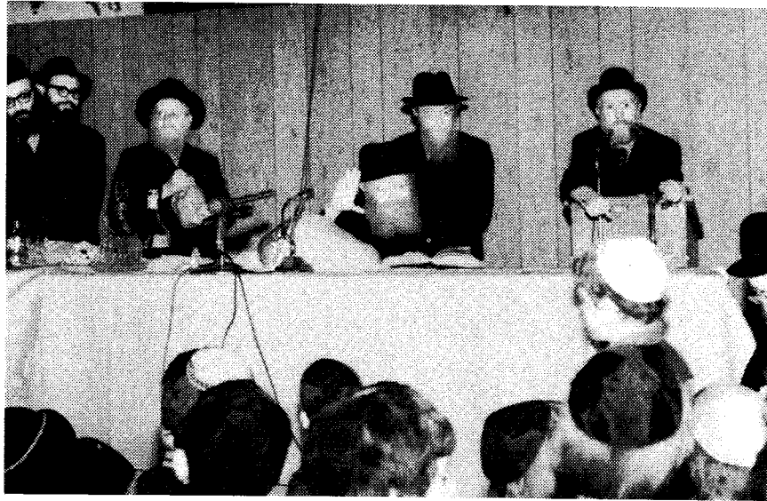
למעלה: בהתוועדות הנ"ל. למטה: בשנת תשל"ז.