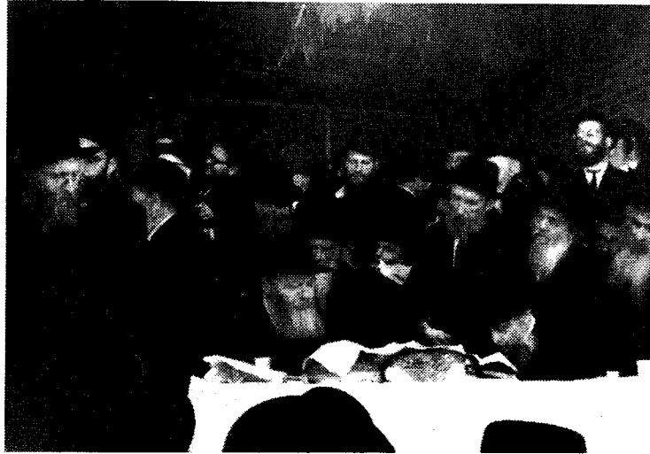
התוועדות שמחת בית השואבה בפוכה - חודמ"ם היתשכ"ח