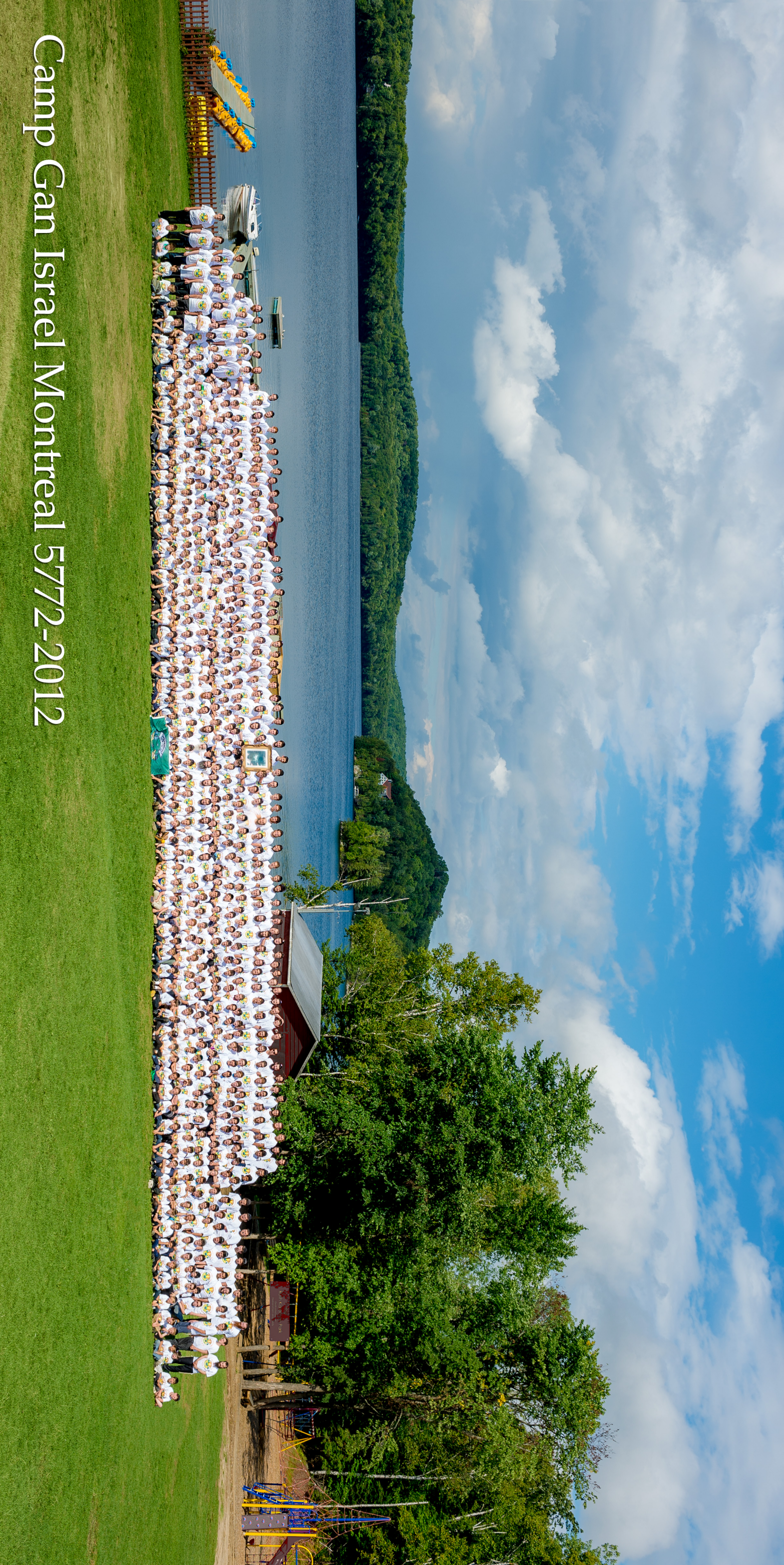
Camp Gan Israel Montreal 5772-2012