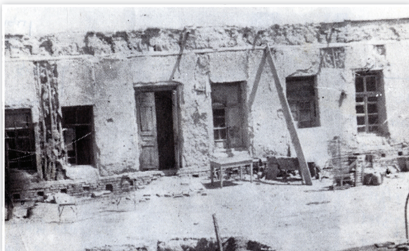
הבית של משפחת מישולבין ששימש במשך לשש עשרה שנה כחדר לימוד מחתרתי. בימי הקיץ למדו במרתף.