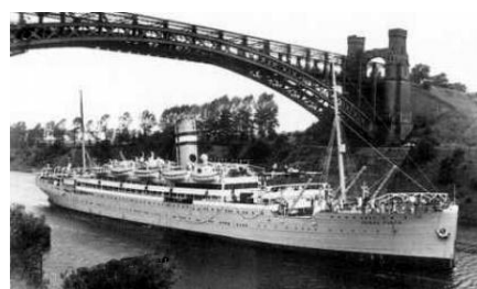
תמונה מהספינה "סורפא פינטא"

ועניין זה נתגלה גם ביום כ"ח סיון (כמה שנים לאחר זה) – שאז התחילה תנופה חדשה בהעבודה דהפצת המעינות חוצה, על ידי כ"ק מ"ח אדמו"ר נשיא דורנו, ביסוד המוסדות המרכזיים "מחנה ישראל", "קה"ת" ו"מרכז לעניני חינוך", ונמשכה העבודה דמוסדות אלו במשך עשר שנותיו האחרונות דכ"ק מ"ח אדמו"ר בחיים חיותו בעלמא דין, ומוסיף והולך ואור גם לאחר הסתלקותו, ובאופן ד"מעלין בקודש".