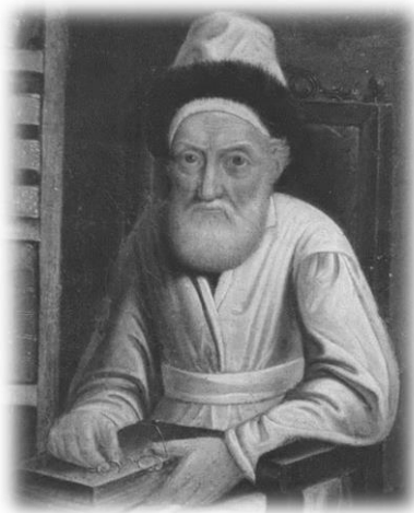
תואר פני כ"ק אדמו"ר הצמח צדק

כו. פעם אמר בעל חידושי הרי"ם דידוע במה שנאמר אודות משה רבינו "ותחסרהו מעט מאלוקים" (תהילים ח, ו) דהיינו שמשה לא השיג בחייו רק מ"ט שערי בינה, ולשער הנו"ן הגיע רק ביום הסתלקותו. וסיים, שהצ"צ מקבל כעת את שער הנו"ן. ובשעת מעשה היה עת הסתלקות כ"ק אדמו"ר הצ"צ.