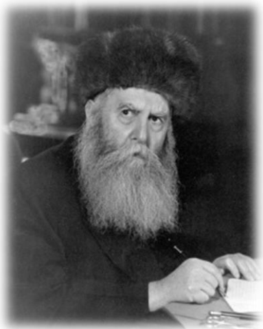
תואר פני כ"ק אדמו"ר מוהריי"צ