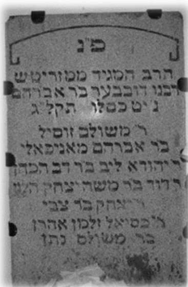
קברו של המגיד ממעזריטש באניפולי

והמשיך החבר לספר שגם עמד בשורה ככולם, ולמרות שלא ראה את המגיד מעולם קרא לו הזמינו המגיד אליו. שאל החבר את המגיד שהרי כאן זה עולם האמת וודאי יודעים שלא ראה מעולם את המגיד בחייו,