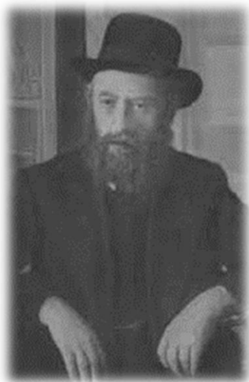
תואר פני כ"ק אדמו"ר מוהרש"ב

לה. פעם הציע רד"צ חן לאדנ"ע, שילכו יחד לשמוע דא"ח מאדמו"ר מוהר"ש, ואדנ"ע סירב באומרו שהלא יש דא"ח שאפשר ללומדו, ומדוע לבקש עוד? הוסיף רד"צ והפציר באדנ"ע שילכו, ולבסוף נעתר אדנ"ע, והוחלט שילכו למחרת בבוקר.