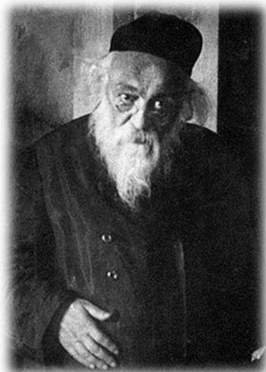
הגאון ר' חיים הלוי סולובייצ'יק מבריסק

תלמידו של ר' חיים סיפר שבאותו הלילה נדדה שנתו של ר"ח, ומיד בבוקר פנה לאדמו"ר נ"ע וביקש את סליחתו. ענה לו כ"ק אדמו"ר שלא את סליחתו עליו לבקש, כי אם את סליחת הרא"ש. שב ר' חיים בהתפעלות אל הגדולים ואמר "ער הייסט גאר בעטן מחילה דעם רא"ש" [הוא אומר שאת המחילה יש לבקש מהרא"ש].