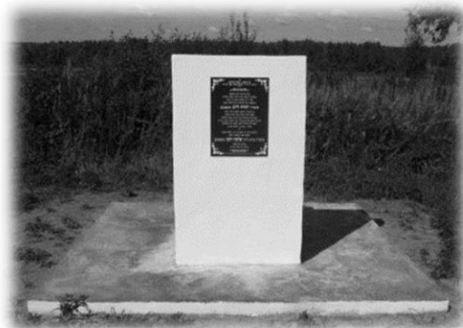
מצבת קברו של המהרי"ל

קכד. המהרי"ל היה מכונה בפי החסידים "דער מיטעלער רבי" שטענדער". פעם שאל אדמו"ר מהר"ש את המהרי"ל לפשר כינוי זה, והשיבו, שאדמו"ר האמצעי היה נשען עליו, ואומר חסידות במשך ג' שעות. אמר אדמו"ר מהר"ש, שכמות זמן כזו הינה