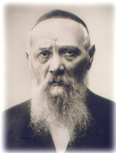
הגאון החסיד ר' לוי יצחק

קיז. ר' דוד אקינאו (ראמאנער) סיפר ששהה במחיצת הגה"ק רלוי"צ בתקופת חתונת בנו כ"ק אדמו"ר נשי"ד, ושלח כ"ק אדמו"ר לאביו איזה עניין בתורת הקבלה, ואמר ע"ז אביו (הלשון אינו מדויק אבל התוכן זהה) "ער האט מיר שוין איבערגעיאגט" [הוא כבר עקף אותי].