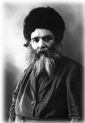
החסיד ר' שלמה זלמן הבלין

קעב. ר' זלמן הבלין היה אומר "לא המתים יהללו י-ה" (תהילים קטו) - 'מתים' אלו הרשעים, 'ולא כל יורדי דומא' - אלו הנמצאים בהשפעת השטן, 'ואנחנו נברך גוי' - וכי אנו צדיקים הגדולים? לכן מסיים ואומר "מעתה ועד עולם", דפירושו הוא דמה שהיה, היה, ומעתה אכן נהיה צדיקים.