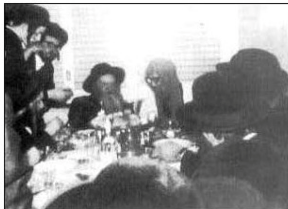
The Lelover Rebbe with the Baba Sali