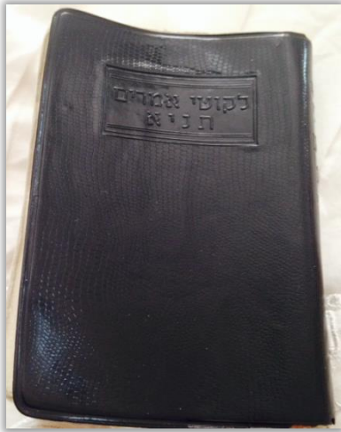
כריכת התניא שקיבלתי מהרבי