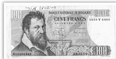
תמונת השטר שקיבלתי מאת כ"ק אדמו"ר