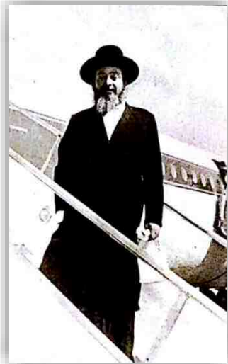
באחד ממסעיו למען הישיבה

חיות והתלהבות. תלמידיו מתארים את המראה שהייתה בישיבה בשעה שהי' מכין את השיעור, איך שהי' הולך הלך ושוב בהיכל הישיבה, מלחש משפטים מעוררים יראת שמים. פעם שמעו אותו חוזר הרבה פעמים "שלא אכשל בלשוני" וחרדת קודש היתה באויר באותו זמן.