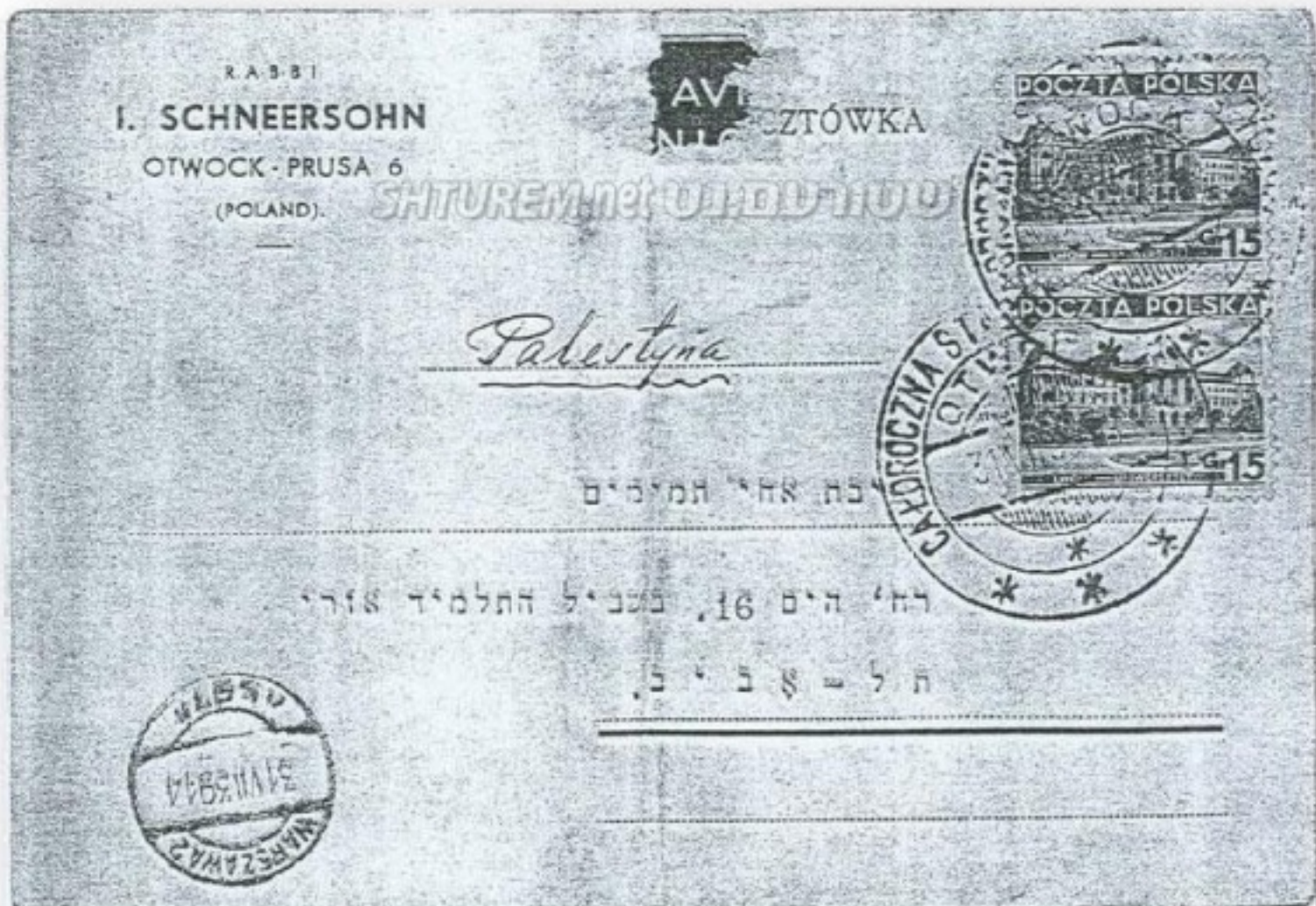
גלויה מכ"ק אדמו"ר מוהרי"צ שנשלחה לאקננו ע"ה לרגל בר המצוה