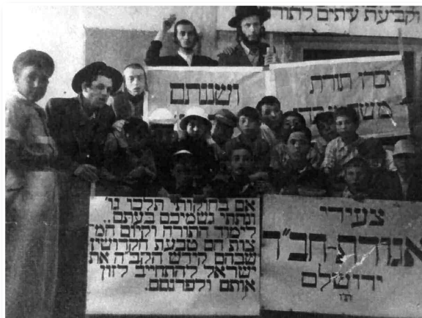
תמונה מפעילות צעירי חב"ד עם הנוער בשנים ההם

מיותר לציין שהתופעה שנקראת בפי ההמון בשם "תנועת התשובה" (אותה חולל הרבי בעולם) של צעירים שאינם שומרי תומ"צ שהחלו לקיים חיי תורה ומצוות לא היתה