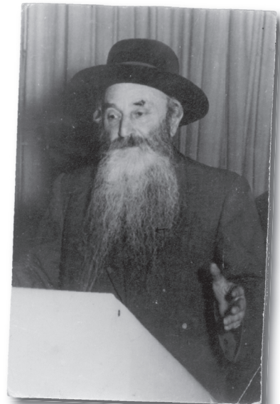
הגאון החסיד רבי אברהם חיים נאה ז"ל