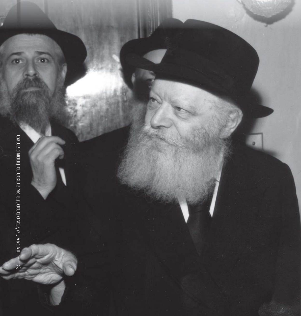
תשורה משמחת בר המצווה של התי' מנתח מענדל שיר' אויטאוו

מהשלוחים נדרש תנאי אחד בלבד, השליח צריך לגרוף מליונר כנ"ל - הדר במקומו הוא,