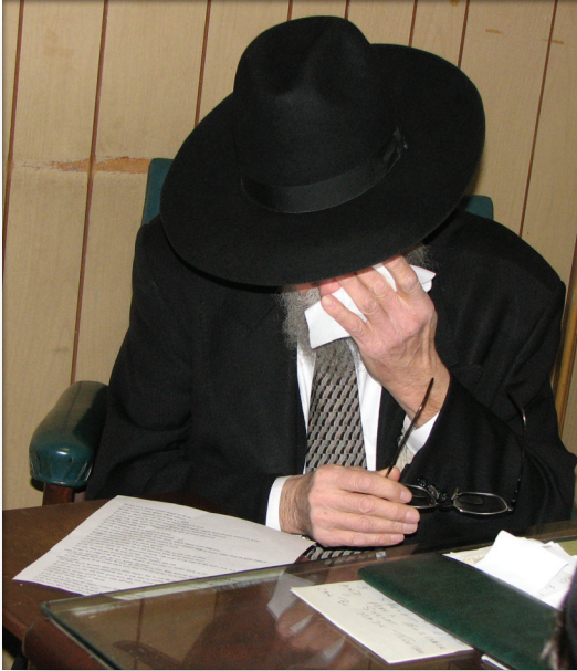
הרב סימפסון מוחה דמעה של התרגשות במהלך הראיון

הצ'קים לרבי, ואחר-כך הרבי אישר לשלוח את הצ'קים לנמענים.