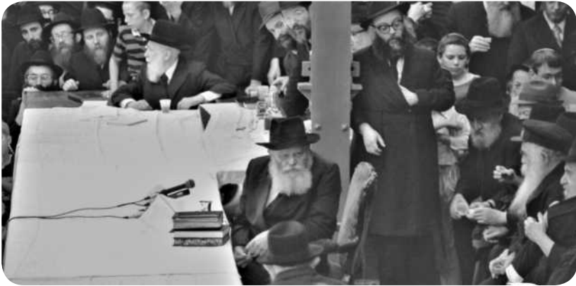
התוועדות ליל ער"ה, כ"ט אלול תשמ"ג