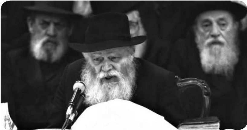
י"ט כסלו תשמ"ז