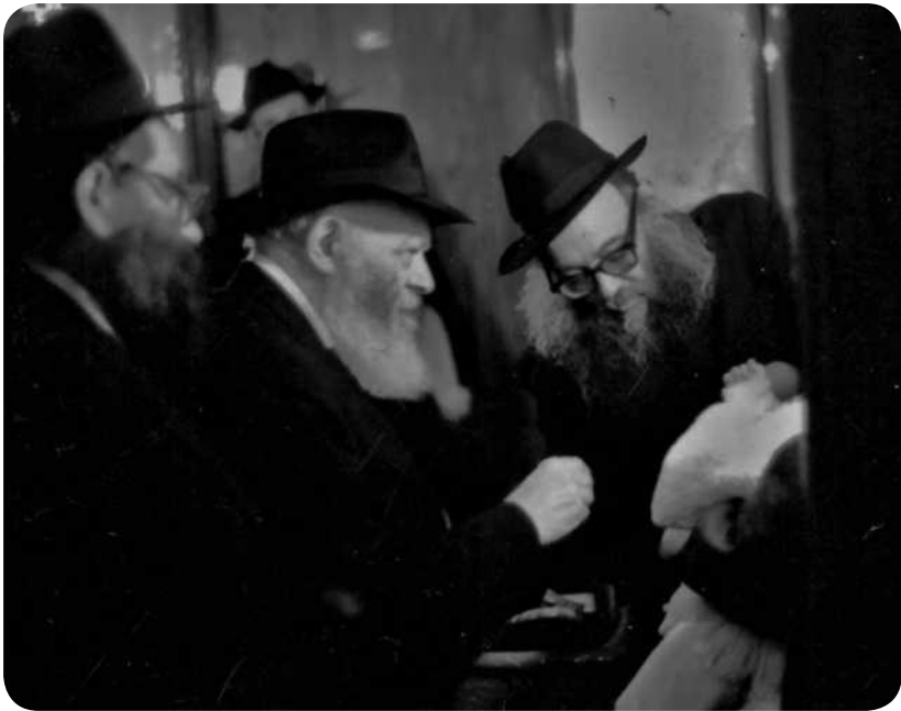
ר"ח אדר תשמ"ז

היום ב. עמדה לקבל צדקה עם ב. שלה, ואד"ש שאל האם יש לה קופה, ואח"כ הוסיף "זאל זיי קריגן היינט" [ - שתרכוש היום] (נוסח אחר: "אויב היינט זי האט ניט, זאל זי האבן מארגן !" [ - אם היום אין לה, אז שמחר יהי לה]).