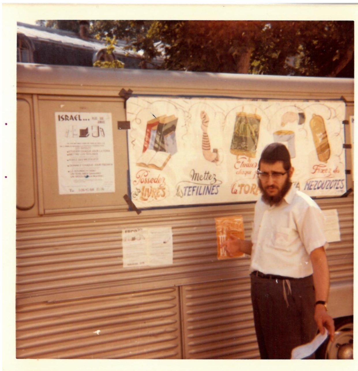
הת' יה"ל מטוסוב מכין את השלטים על הטנק