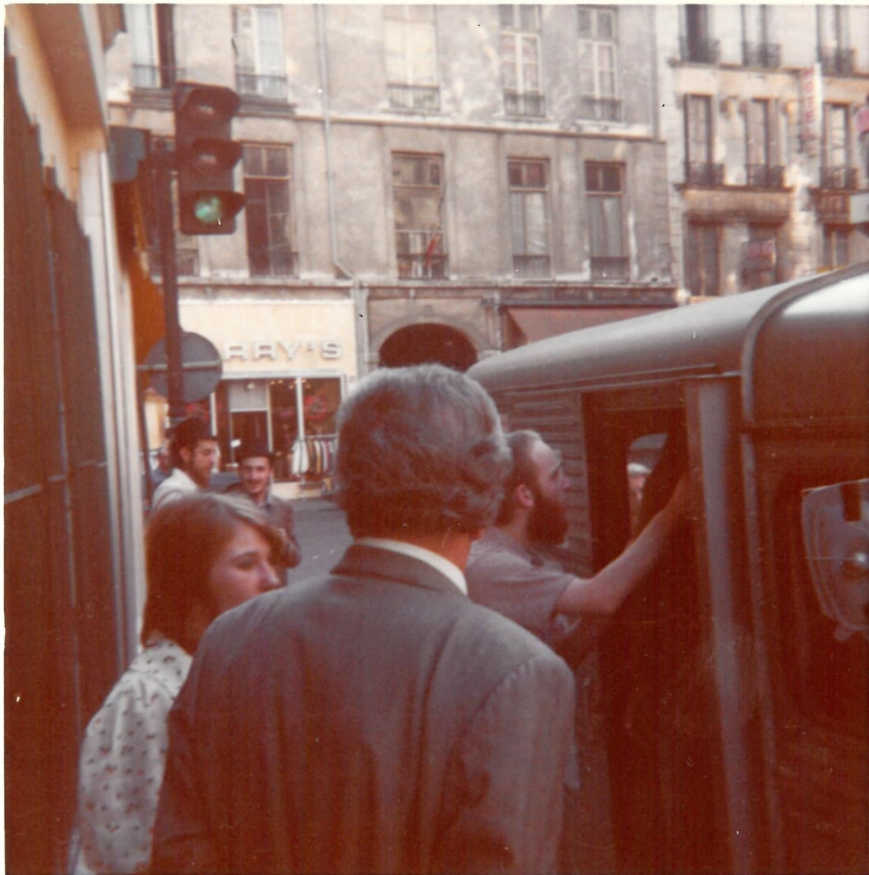
הטנק ברחובות פריז