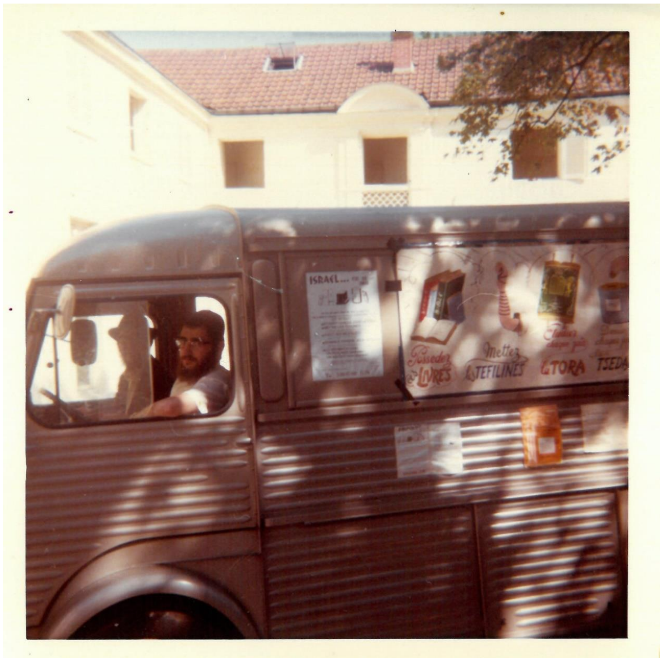
הת' יה"ל מטוסוב נוהג בטנק