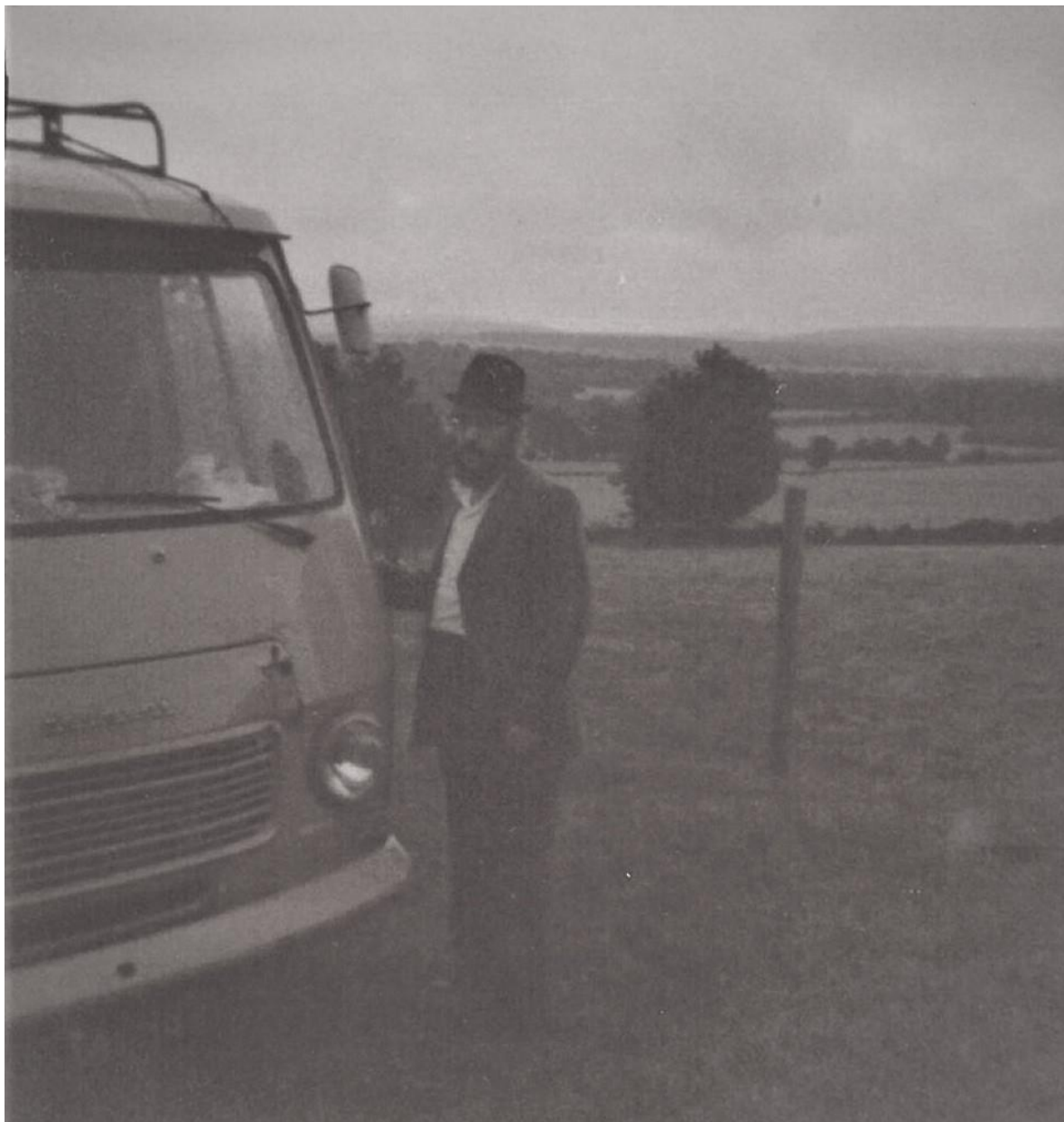
הת' יה"ל מטוסוב עם הטנק בנסיעות בערי השדה