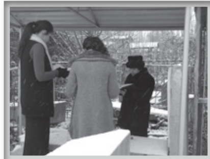
הרבנית והתלמידות השליחות בתפילה על קברו והמרבית, כמו למשל סיפור מוזר שנאמר לנו

בחודשי עבודה רצופים, הגיעו הישגים מרשימים, ריצוף מחדש סיכוך מתאים ומצבה חדשה, כיאה לקברו של הקדוש ר' אברהם שניאורסון, נכדו של אדמו"ר הצמח צדק, חותנו של כ"ק אדמו"ר מהורש"ב, חמיו של כ"ק אדמו"ר מהוריי"צ, זקנו של כ"ק אדמו"ר שליט"א והרבני, דור חמישי