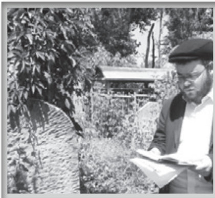
תפילה על קברו טרם השיפוץ

עם מציאת המצבה ומיקום הקבורה לאחר תפילה קצרה לגאולה השלימה ואמירת מספר פרקי תהילים, החל להעתיק את הכיתוב מן