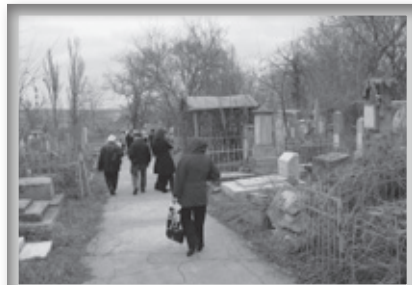
יהודי המקום מבקרים בקברו

ללא מחשבה ושימת לב נכרתו עצים באופן בלתי מחושב, עשרות קברים ישנים נפגעו, עשרות קברים הפכו לגל אבנים, עקב עוצמת הגזעים הגדולים שנפלו עליהם.