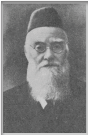
הרב יהודה לייב צירלסון

לך סיפור, כידוע היו אנשי הישובים והכפרים הגרים בין הגויים נוסעים לכבוד הימים הנוראים לעיר הסמוכה