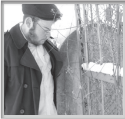
איתור קברו בשלג הקפוא