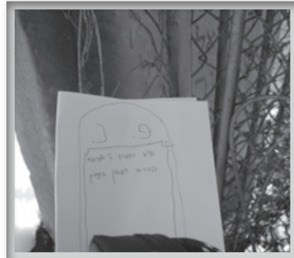
כתיבת המצבה מהאבן המתפוררת

המקום היה בהזנחה קשה, ענפים ודברים נוספים הסתירו את שברי המצבה.