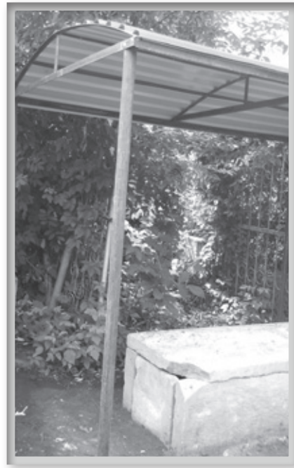
הקמת כיסוי למצבה