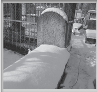
קברו מכוסה בשלג טרם השיפוץ

הרה"ק ר' אברהם שניאורסאהן נכדו של כ"ק אדמו"ר הצמח צדק מליובאוויטש