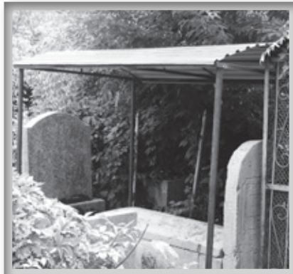
מקום קבורתו לאחרי השיפוץ