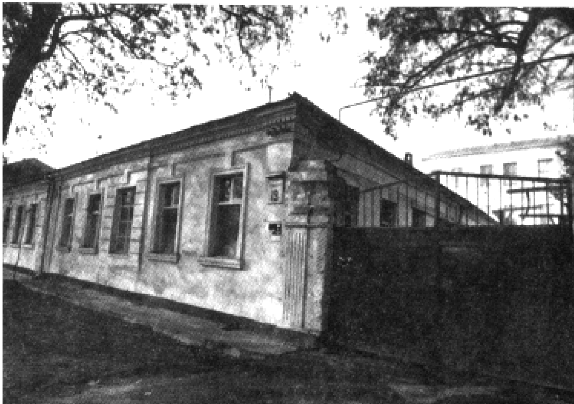
בית הכנסת של רבי מאיר שלמה, שם התפלל כ"ק אדמו"ר מה"מ בילדותו